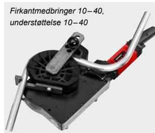
Firkantmedbringer 10–40, understøttelse 10–40