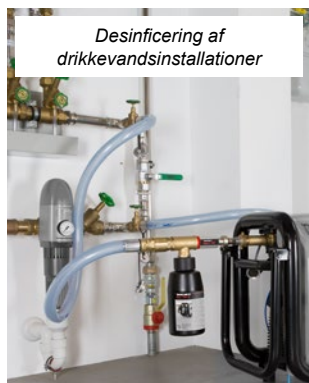
Desinficering af drikkevandsinstallationer