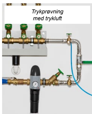
Trykprøvning med trykluft