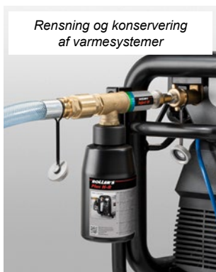
Rensning og konservering af varmesystemer