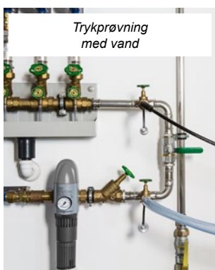
Trykprøvning med vand

Effektiv, kompakt, elektronisk skylle- og trykprøvningsenhed med oliefri kompressor. Kun et apparat med mere end 10 automatisk kørende programmer. Skylning og afslamning af rør op til DN 50, Ø 2", med et vandtryk røret op til 1 MPa/10 bar/145 psi, vandtemperatur 5–35° C, vandgennemstrømning op til 5 m 3 /h. Trykprøvning med trykluft op til 0,4 MPa/4 bar/58 psi. Trykprøvning med vand op til 1,8 MPa/18 bar/261 psi. Til reguleret fyldning af beholdere af enhver art med trykluft op til 0,8 MPa/8 bar/116 psi. Drift af trykluftværktøjer med driftstryk op til 0,8 MPa/8 bar/116 psi, sugeseffekt op til 230 NI/min.