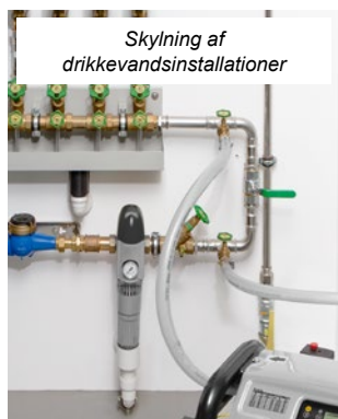
Skylning af drikkevandsinstallationer