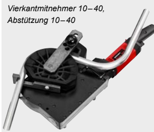
Vierkantmitnehmer 10–40, Abstützung 10–40