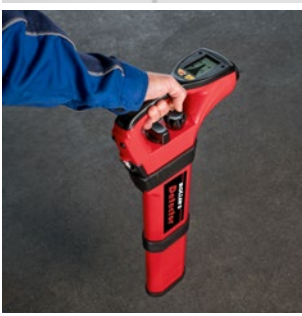
Ortung eines Kamerakopfes mit ROLLER'S Detector (Zubehör)

Besonders kompaktes, leichtes, elektronisches Kamera-Inspektionssystem für brillante Bilder und Videos aus Rohren und Kanälen Ø 40–150 mm, Schornsteinen und anderen Hohlräumen. Selbstnivellierende Kamera. Sender zur Ortung der Kamera. Mit elektronischer Meterzählung. Für Dokumentation von Videos und Bildern mit Sprachaufzeichnung auf SD-Karte. Für Akku- und Netzbetrieb.