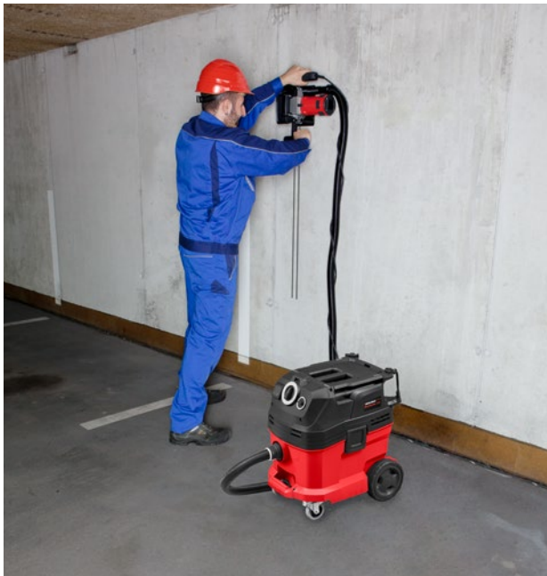
Saugen von gesundheitsgefährdenden Stäuben beim Trennen und Schlitzzen