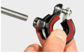
Patent EP 1 459 825, Patent US 7,284,330