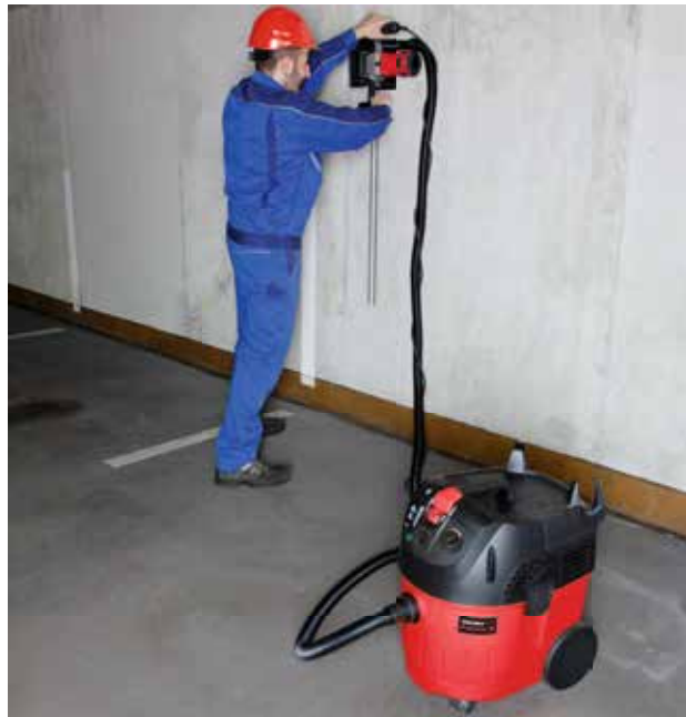
Saugen von gesundheitsgefährdenden Stäuben beim Trennen und Schlitzten